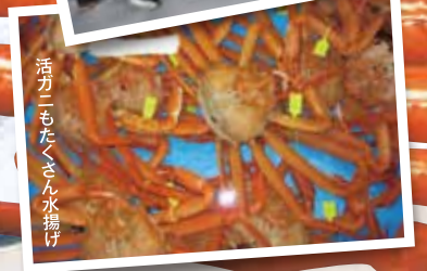
活カニもたくさん水揚げ